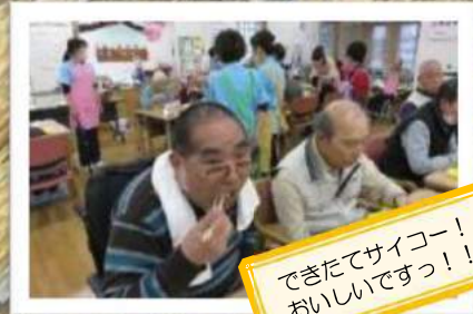
できたてサイコー! おいしいですっ!!