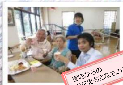
室内からの お花見も乙なものです。