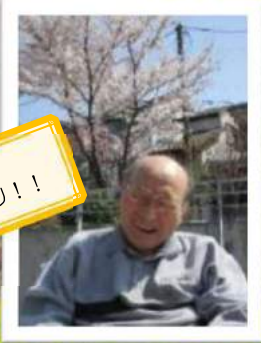
満開の桜をバックに満開の笑顔をパシャリ！！