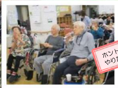
ホントは桜の木の下でやりたかった・・・