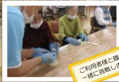
ご利用者様と職員が 一緒に挑戦しました。