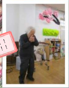
お見事！あっぱれです！！来年もお願いします！！