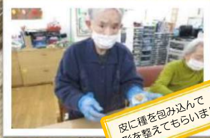
皮に種を包み込んで 形を整えてもらいました。