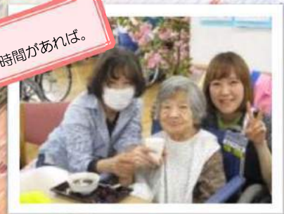
桜がなくても家族と過ごす時間があれば。