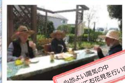
心地よい陽気の中 外に出てお花見を行いました。