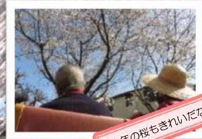
今年の桜もきれいだなあ……