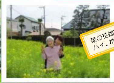
菜の花畑でハイ、ポーズ！！