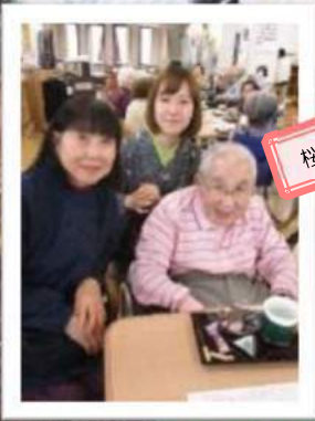
桜がなげりゃ桜餅♪