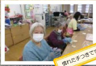
慣れた手つきです!!