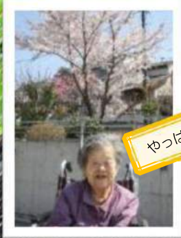
やっぱり外は気持ちいい！