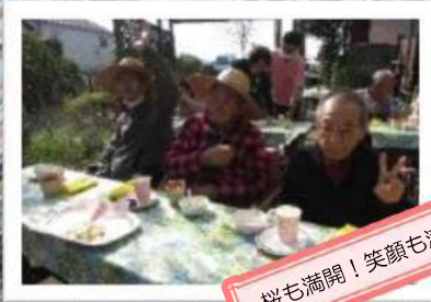
桜も満開! 笑顔も満開!